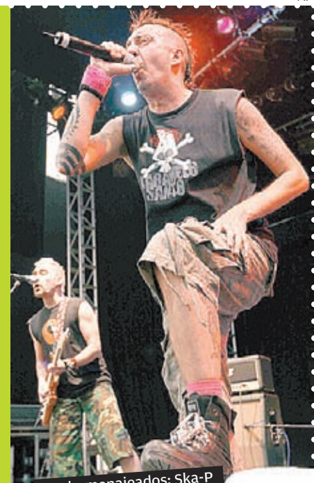
Los homenajeados: Ska-P

No Tiene la Vaca, Charales-K, Cirko Kandela, Los Gargas, La Mugrosa Ska, La Proleska, Mal Secreto, Artículo 33, The Donatelos, Misterio a La Orden, Chicharrón con Peloz ( sic ), Ke La Chupe Minerva, Pachamama Ska, Zonora Alkoholika, Pateando Bolas, No Hay Fianza, Kazando Puerkos, Kachirules Ska, Gato Empulgado, Hay te Voy, Skina de Burros